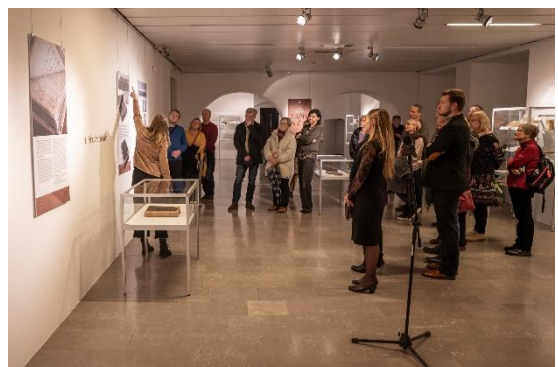
Razstava Zapisi in čas, 2023