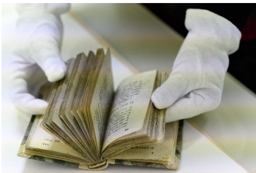
Posebna zbirka raritet – Kolomonove bukve

Tudi v letu 2025 načrtujemo nadaljevanje retrospektivnega vnosa posebnih zbirk v elektronski katalog in sicer slikovnega gradiva iz Fototeke, rokopisnega gradiva in gradiva iz drugih posebnih zbirk.