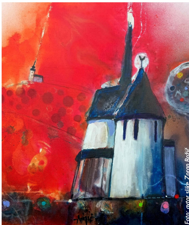
Veduta Mute (od rotunde Sv. Janeza Krstnika do farne cerkve Sv. Marjete)

Razstava bo na ogled do 25. aprila. Prisrčno vabljeni!